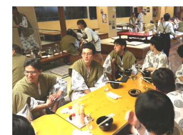
3次会でステーキ丼完食🍱 若手社員の食欲半端ないって！！

編集後記：昨シーズンの冬は大雪の為に通勤や雪かき等大変でした。今シーズンは暖冬の子報ではありますが、備えあれば憂いなしとも言いますし、道具の準備はしておきましょう。また大雪時高速道と一部国道でチェーン装着をしないと通行出来ない区間も設置されました（石川県では高速、8号線共に福井県との県境です）。冬は普段より早めに通勤するなどゆとりを持った通勤を心がけ無事故無違反でお願いします。