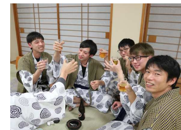
盛り上がる男性陣 左から伸びる手は誰でしょう！？