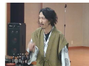
嶋田係長より 熱い思いを込めた中締め