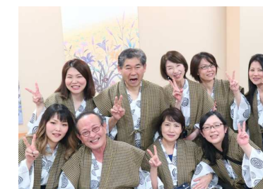
ほろ酔い気分の元気な女性たち！ 押され気味？の社長&ご機嫌な会長